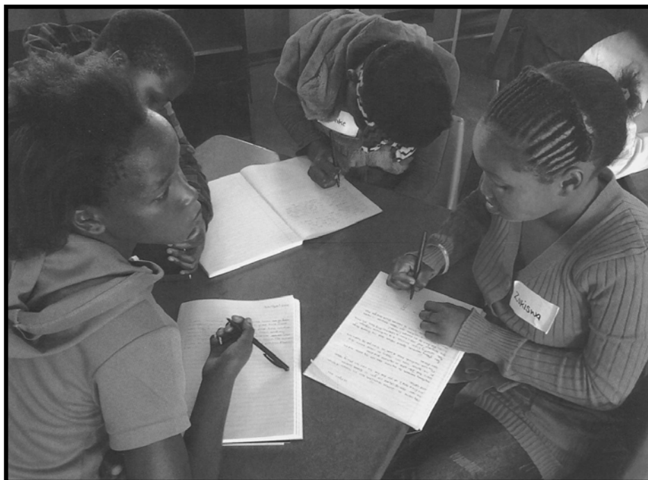
[Xifaniso lexi xi huma eka magazini ya Skyways ya Nhlangula 2013]