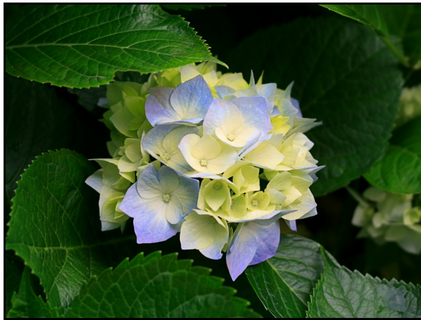
[Xi huma eka: Sample pictures]