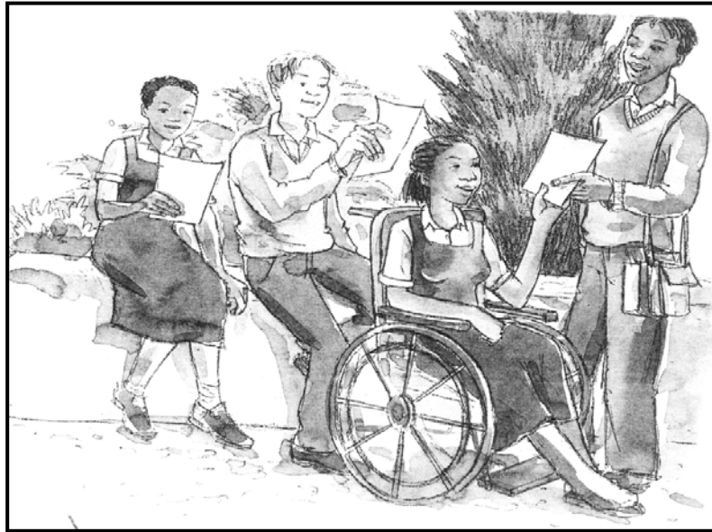
[Tshi bva kha: LO Grade 9 ]

1.7 Tšalelani tshifanyiso itshi nga vhuronwane uri ni do kona u n'wala maanea ane a anana natsho. Maanea anu ni a nee thoho ine na funa.