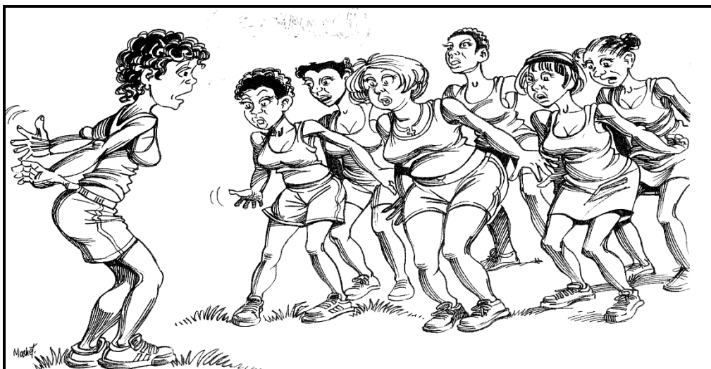
[Tshibva kha: LO Grade 10 ]