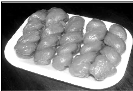
Die Suid-Afrikaanse koeksister