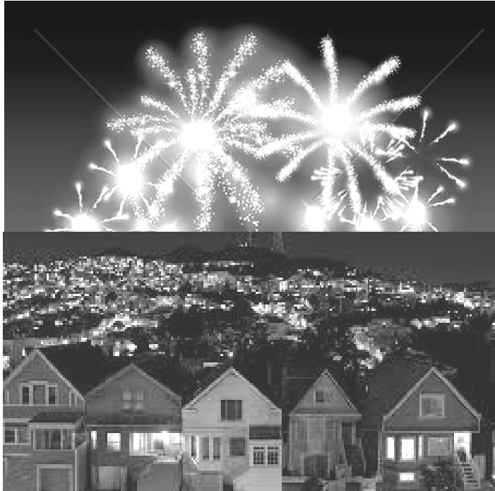
[Verwerk uit: www.google.com ]