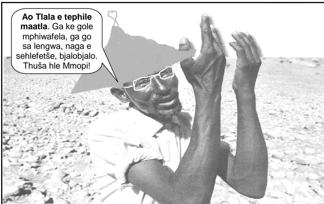
[E amantšwe go tšwa go: CEDAW in South Africa]