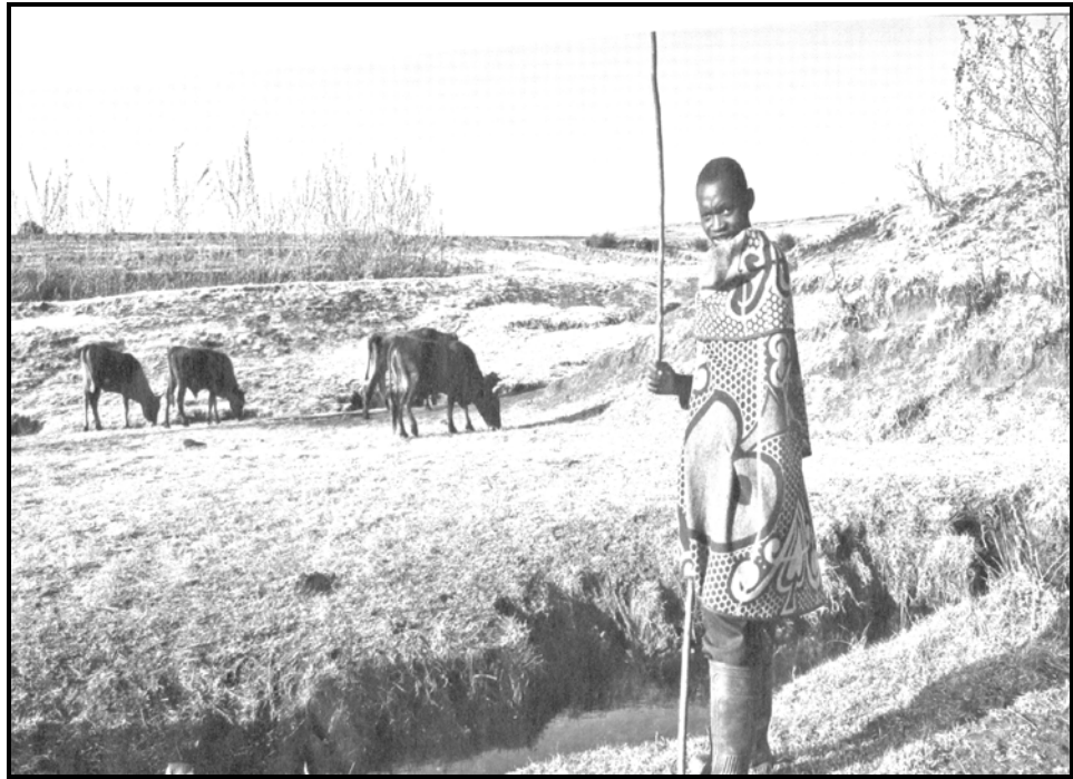
[Zwi bva kha magazini ya getaway]