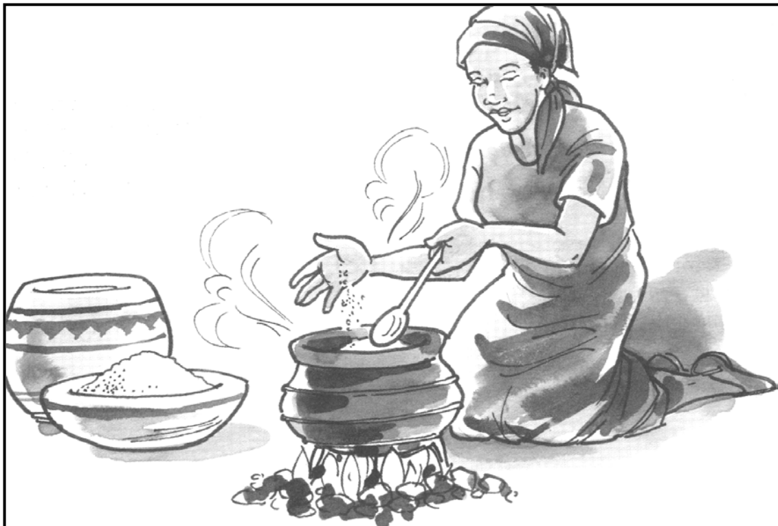
[Polelo ke lehumo, M Maja le ba bangwe]